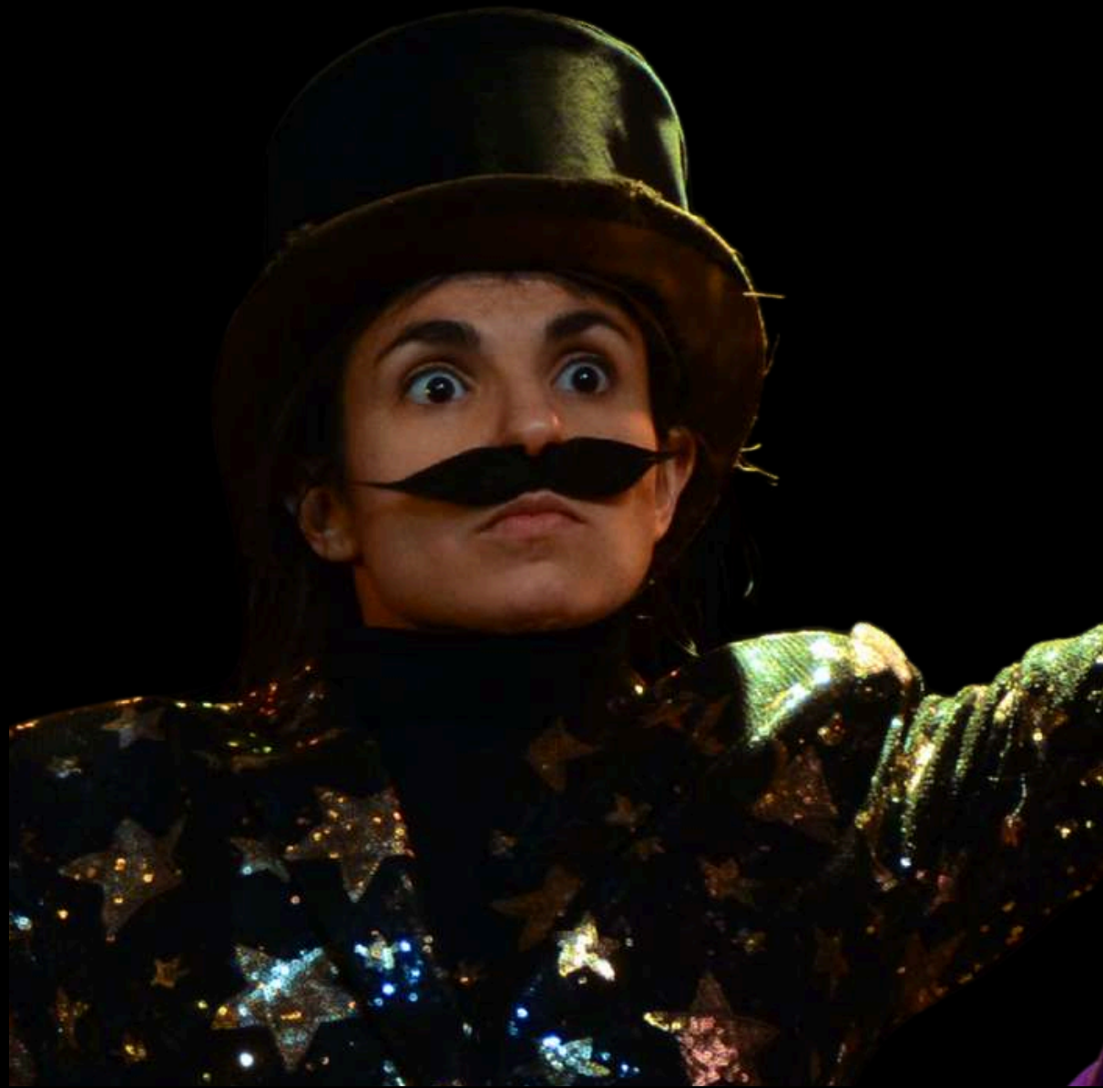
Moustache, le directeur du Cirque