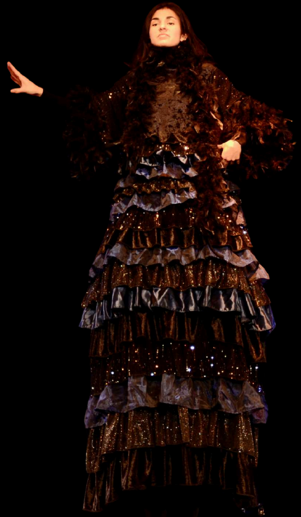
La Grande Chorégraphe