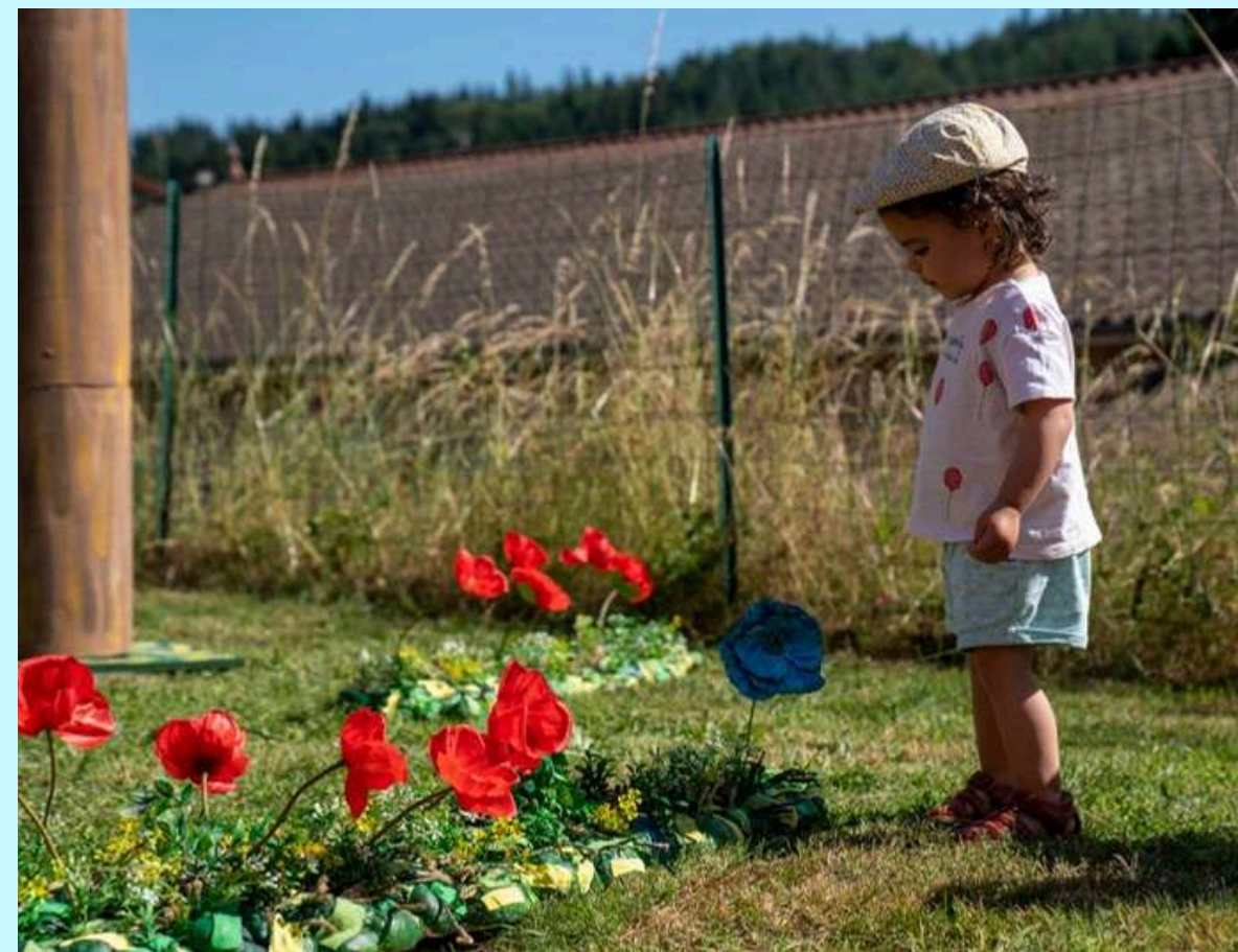
Photos : représentation à la crèche Bulles de Mômes / Crédit : Romain Chambodut